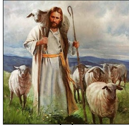
Copyright © J. S. Paluch Co.

Until we come to a profound realization of how much we need a shepherd, we cannot appreciate how deeply blessed we are to have been given a Shepherd, one who laid down his life for us and was raised to life eternal in the Spirit, so he might guide us and we might follow him in faith forever.